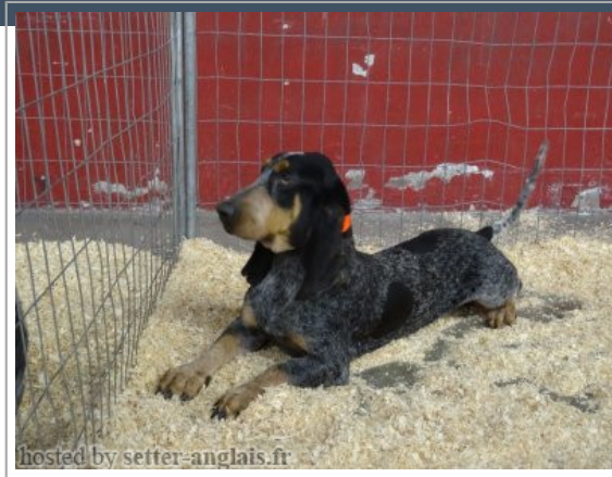
hosted by setter-anglais.fr

2014-03-23 (M) LOF 6820/1029 fiche affixe