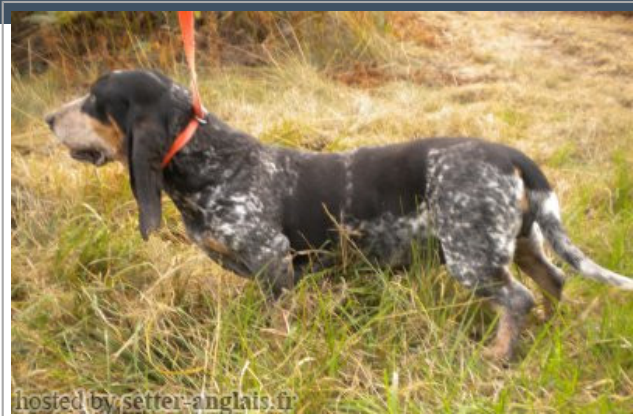
hosted by setter-anglais.fr

2007-09-19 (F) LOF 5682/1317 fiche affixe